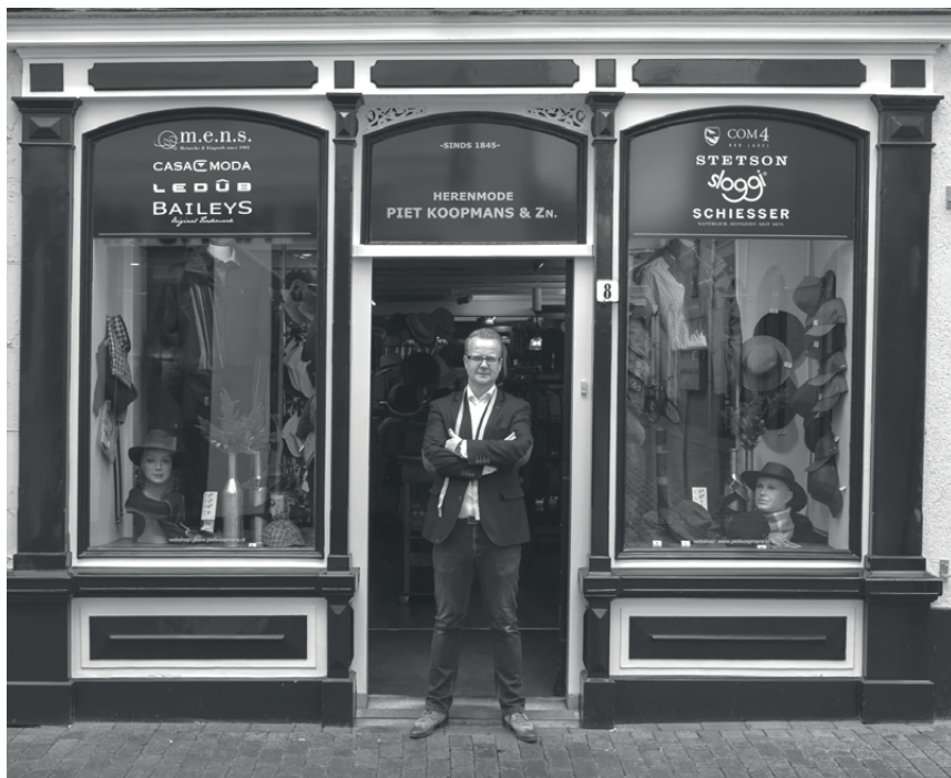
1919 SJOUCHE KOOPMANS MODE MEPPEL 2019